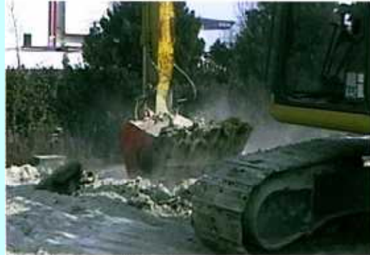
ドライブミキシング作業現場

高含水汚泥処理(ヘドロ処理)、残土処理、固化剤、セメント等を始めとした土質改良剤などの均等な混合作業、かく拌作業など…。作業用途にあわせて幅広いラインアップの中からお選びください。ドライブミキシングでは、コンパクト設計の回転ドラム部とフルバケット形状により、大容量の掘削・混合作業を高速に処理します。油圧モーターのシンプル構造、交換型駆動爪でメンテナンスが非常に簡単です。また、フローコントロールバルブを内蔵し、さまざまな形式の油圧ショベル(1ポンプ仕様及び2ポンプ仕様など)でも、つねに安定した作業(回転)性能を発揮することができます。もちろん、アダプターボス対応によりあらゆる機種に取付が可能です。